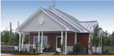
Демонстрационный дом, построенный компанией Neorog USA в Новом Орлеане к годовщине урагана «Катрина»

На протяжении многолетнего сотрудничества с ведущими производителями бетона и инженеринговыми компаниями, архитектурными бюро и химической промышленностью, фирме Neorog удалось разработать новые продукты из пеноминералов: