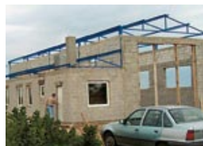
Строительство производственного здания из пенобетонных блоков в Сербии