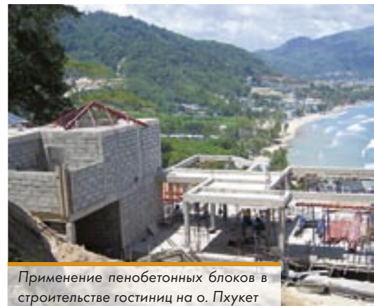
Применение пенобетонных блоков в строительстве гостиниц на о. Пхукет

Органический, биологически разлагаемый продукт с длительным сроком хранения и гарантией в течение двух лет со дня оплаты. Поставляется в запечатанных пластиковых бочках по 200 кг каждая. Легко растворяется в питьевой воде в пропорции 1:40. Одобрен регулирующими органами, прошел тест на содержание хлорида. Одной бочки достаточно для производства 200 м 3 пенобетона плотности 1200 кг/м 3 .