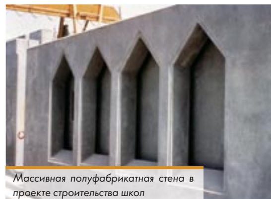
Массивная полуфабрикатная стена в проекте строительства школ