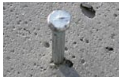
В пенобетонных блоках хорошо держатся обычные гвозди