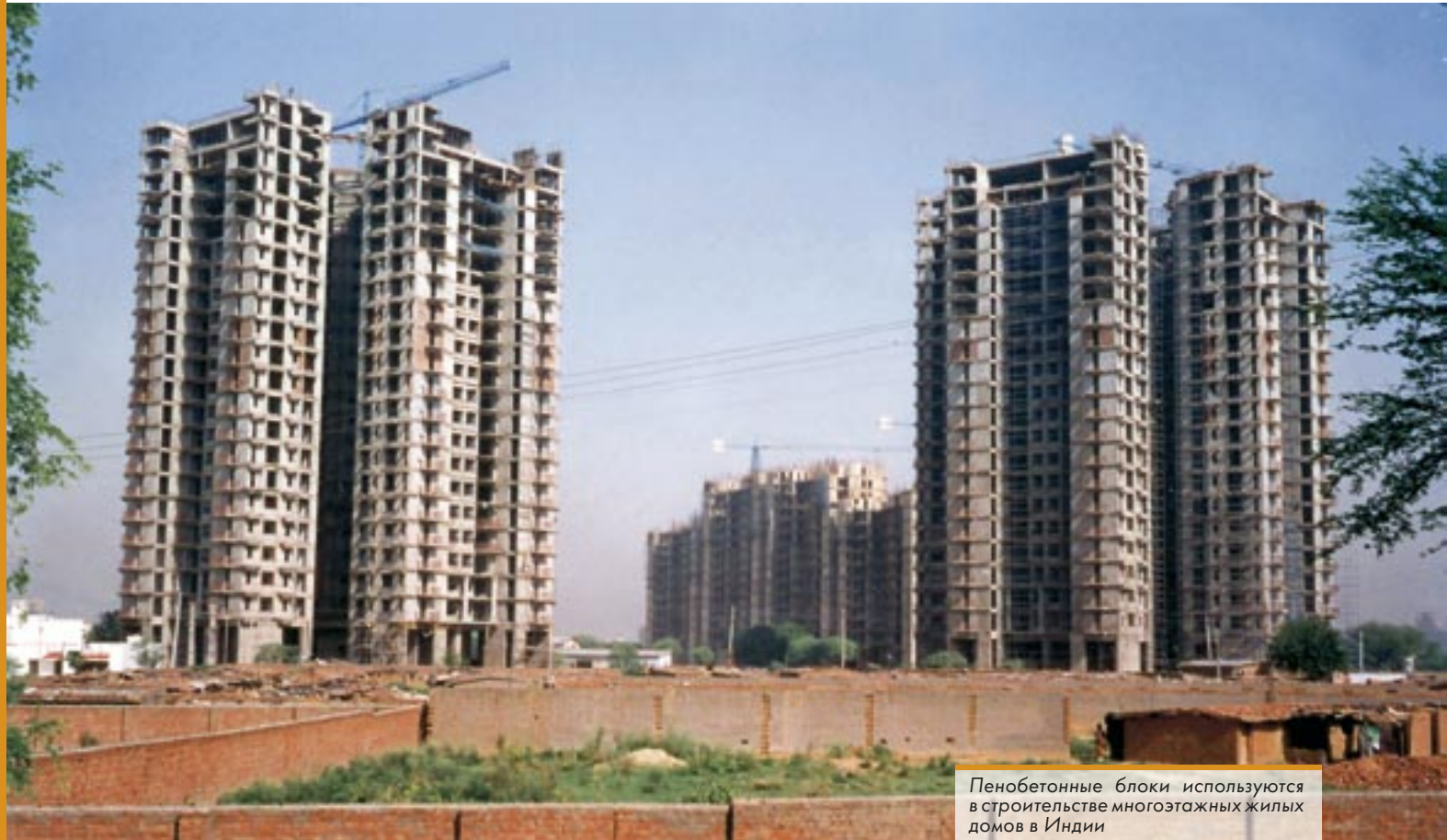
Пенобетонные блоки используются в строительстве многоэтажных жилых домов в Индии

Пенобетон Неорог был разработан более 30 лет назад, и за это время из него было построено свыше 300 тысяч зданий с применением легких блоков, изделий, или заливки зданий на стройплощадках в 50 странах мира.