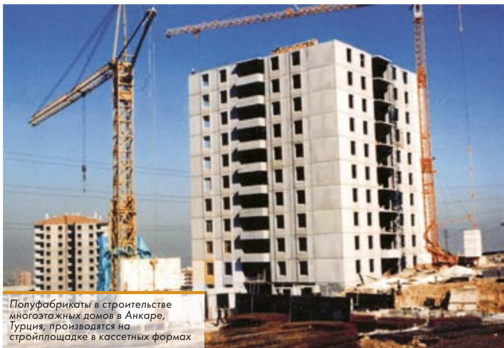
Полуфабрикаты в строительстве многоэтажных домов в Анкаре, Турция, производятся на стройплощадке в кассетных формах

дения зависит от температуры использованного цемента и влажности окружающей среды. Если необходима акселерация, можно использовать быстро схватывающийся цемент, обогрев, пропаривание или химические добавки – также как при работе с обычным бетоном. В отличие от автоклавного пенобетона, твердение в естественных условиях способствует улучшению свойств нашего материала и позволяет сократить издержки производства. Благодаря эффекту воздушных пузырьков, который обеспечивает пена, структура пенобетона очень однородна. При заливке пенобетона в формы вибрация не нужна, а поверхности блоков, соприкасающихся со стенками формы, будут иметь ровную и гладкую поверхность. Еще одно важное отличие Neorog от автоклавного ячеистого бетона состоит в том, что наш продукт продолжает набирать прочность на протяжении длительного времени при воздействии атмосферной влажности, и его не обязательно отделывать защитными материалами.